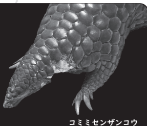
コモドセンザンコウ

ミュージアムが新たに収蔵した自然史標本の中から選りすぐりの逸品を特別公開します!