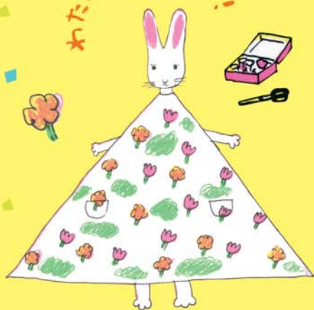
にしまきかやこ「わたしのワンピース」